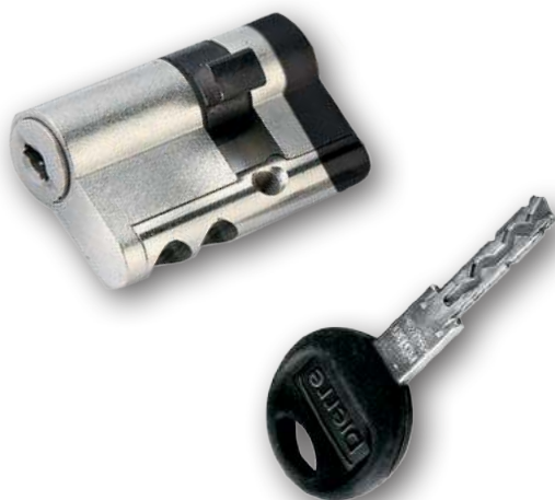
Chiave standard Standard key